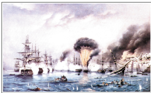
Синопское сражение. Литография с картины А.П. Боголюбова